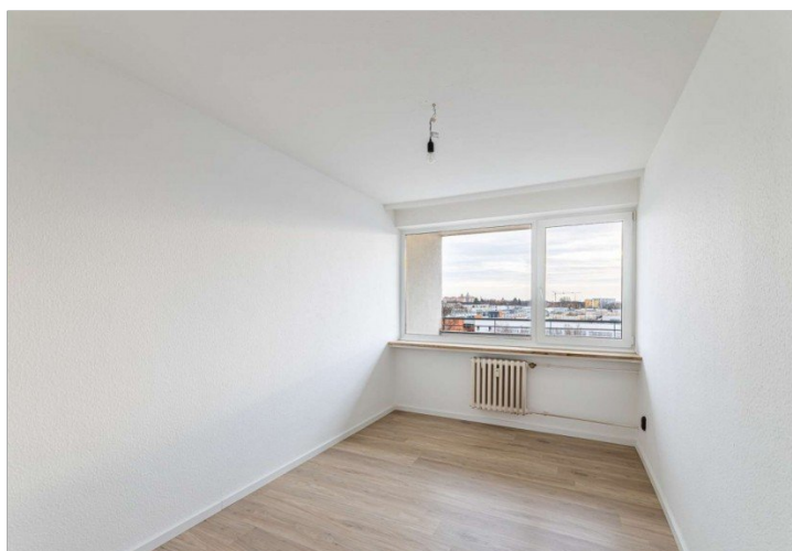
Büro / Gäste