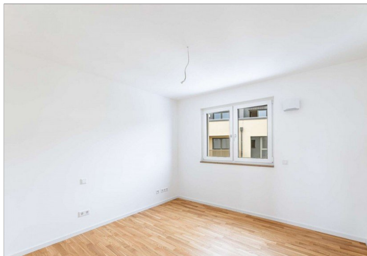
Kinderzimmer / Office