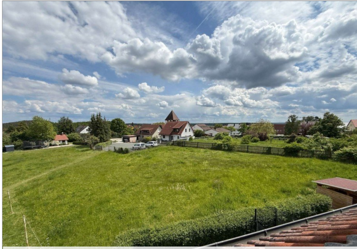
Ausblick von Balkon